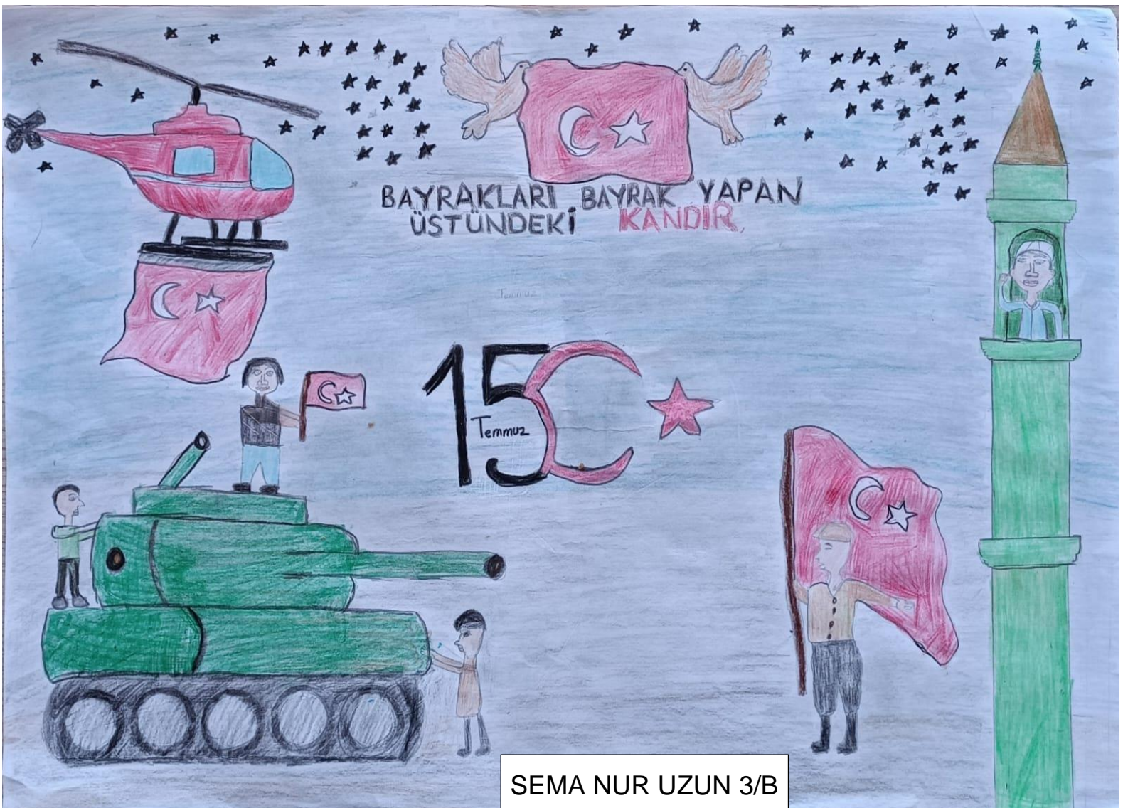
SEMA NUR UZUN 3/B