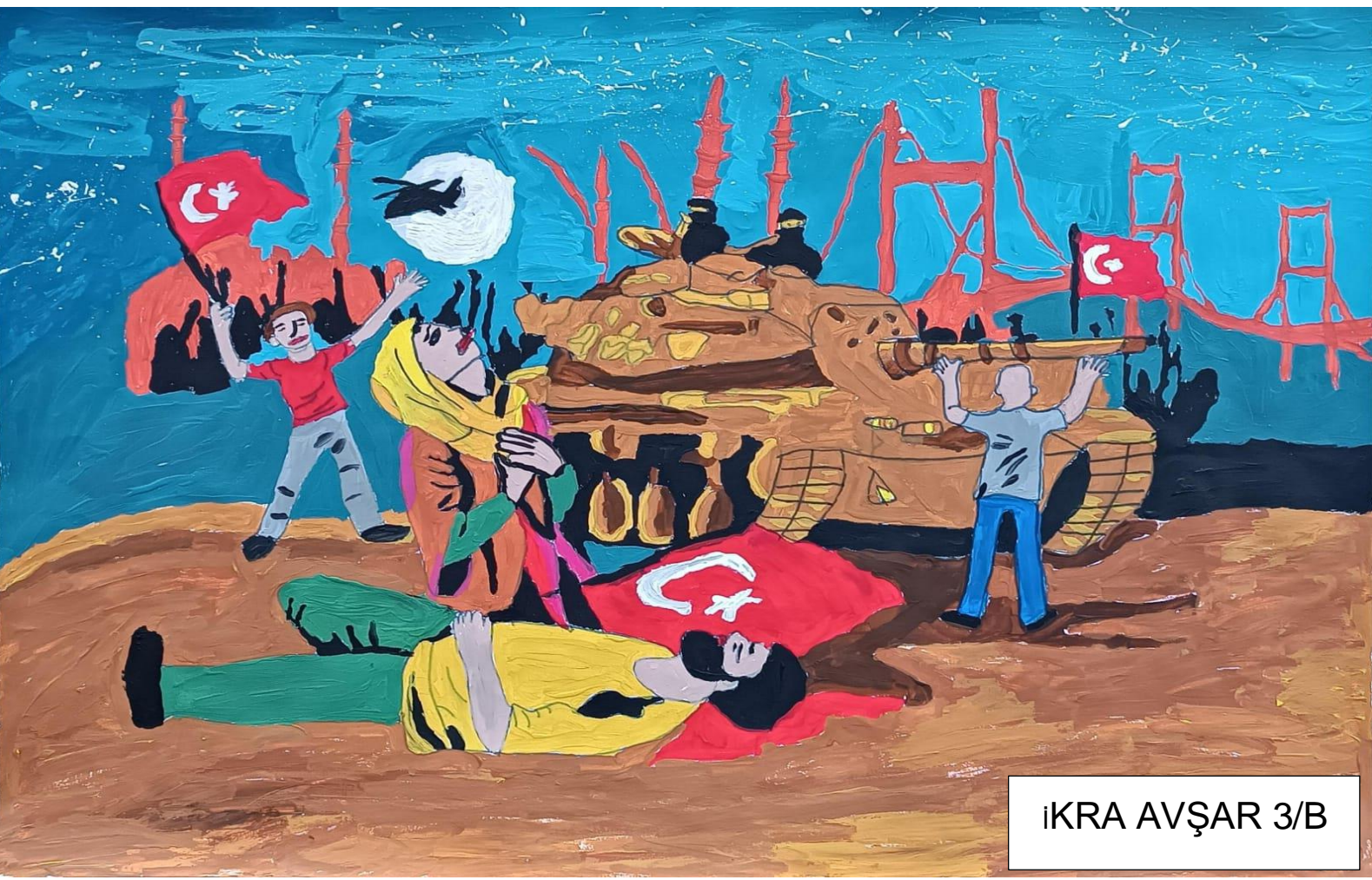
İKRA AVŞAR 3/B